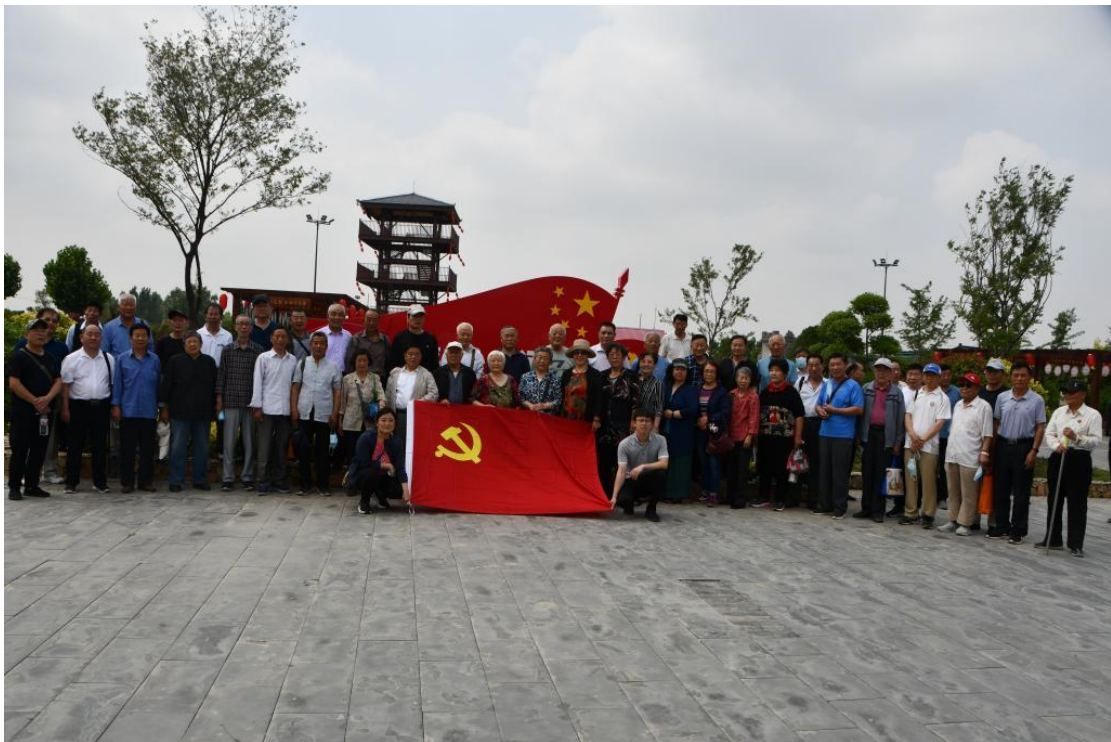
离退休老同志赴运河支队开展党性教育