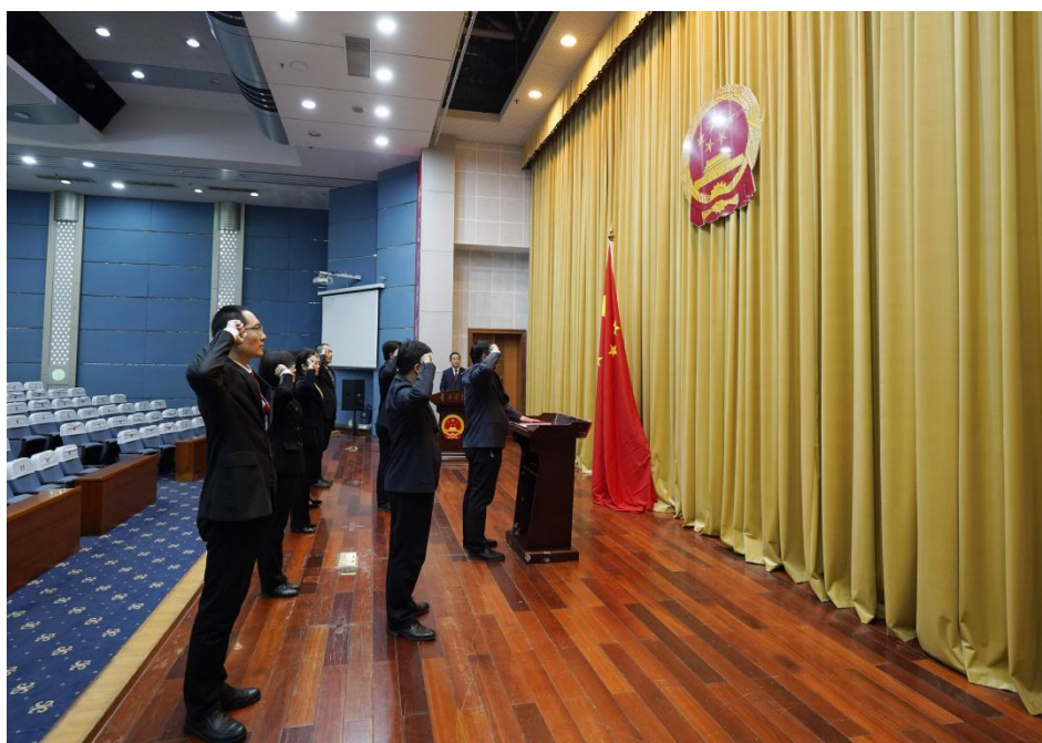
2023 年 3 月 6 日，校纪委举行监察官宪法宣誓仪式