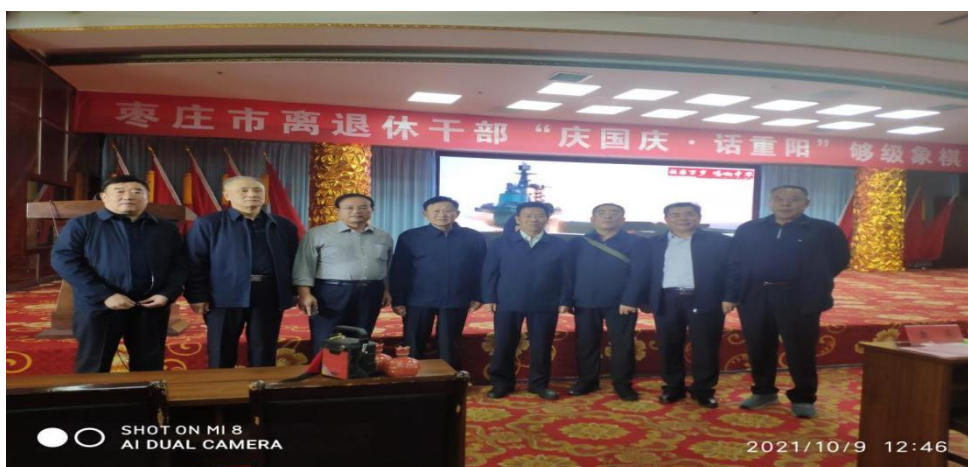
离退休老同志参加“庆国庆、话重阳”银发乐享够级象棋比赛