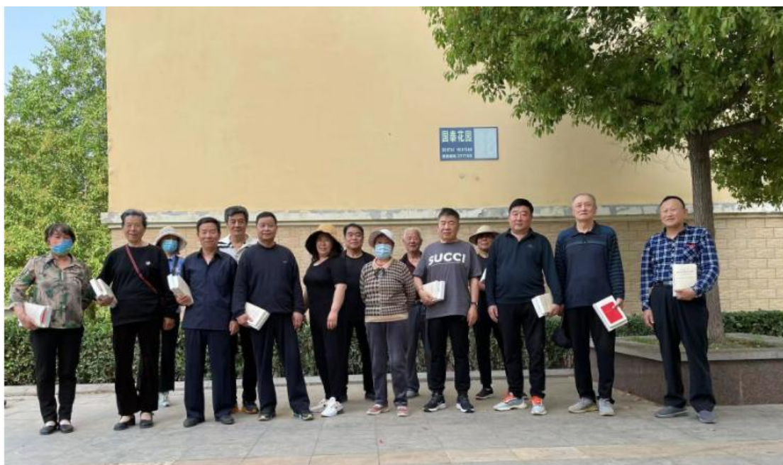
“送学上门”暖人心，“银发学员”不掉队

“党旗永不褪色，夕阳发挥余热”是离退休第二党支部的特色。党支部结合实际情况，创新形式，以推动文化养老和健康养老为目标，积极推动离退休教职工社团组织建设，通过社团活动，增强组织凝聚力，提高组织生活的吸引力和实效性。离退休第二党支部积极组织参与体育养生协会、棋牌协会、书画协会、乒乓球协会、合唱协会 5 个老年社团，离退休教职工八段锦培训活动、“庆国庆、话重阳”银发乐享够级象棋比赛等老干部喜闻乐见的活动，丰富老同志的业余文化生活。支部履行全心全意为人民服务的宗旨，强化“以人为本”的观念和服务意识，密切联系群众，对个别党员因病因事不能集中参加的，开展“送学上门”，增强了党员对党组织的归属感，确保每一位党员理论知识学习不漏学、不掉队“不缺课”“不漏学”“不掉队”“全覆盖”，解决离退休老党员年老体弱、学习困难的问题。