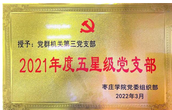
党支部近三年先后获得的荣誉称号